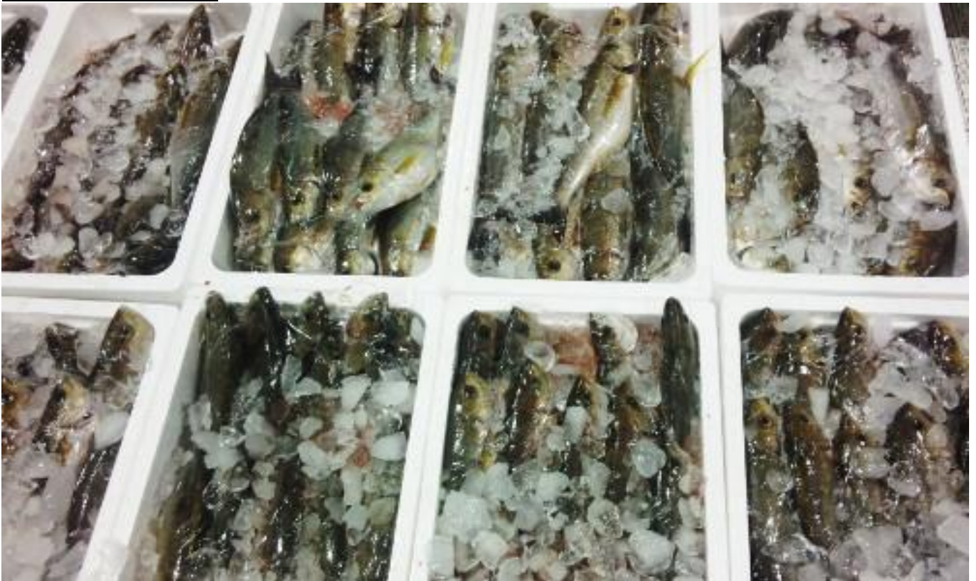
氷冷放血締め処理されたイサキ

仙崎では季節によってイサキの漁法が違います。旬とされる5月、6月にもっとも漁獲量の多いのは沖建網漁。そして、この時期を過ぎると一本釣りや定置網による水揚げが主体となります。仙崎市場では現在のところイサキのブランド認定を行っていませんが、船上で生き締めされ氷冷処理（氷冷放血締め）を施したイサキは専用札をスチロール箱に添付して鮮度保持施術をアピールしています。